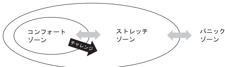
図2 ロンキのCSPモデル (Rohnke, 1995) を一部改変